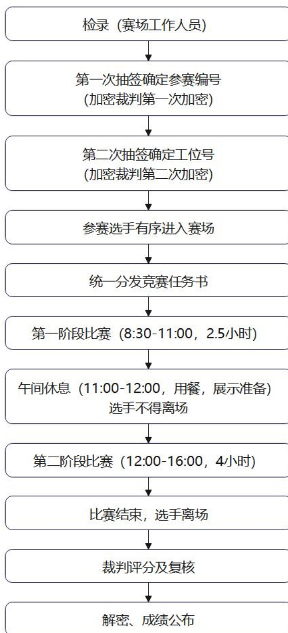
图 1 竞赛流程图