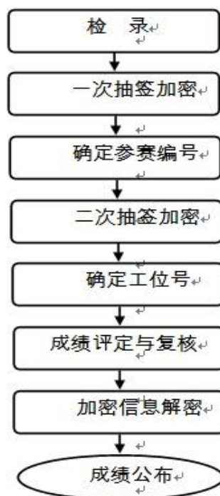
图 2 成绩管理流程图